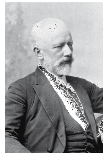
Pjotr Iljitsj Tjajkovskij

Den ryske kritikern Assafjev skrev en gång om denna symfoni: "Den upprörda stämningen i det inledande allegrot är driven till det ytterstas gräns på ett sådant sätt att den lyriska upplevelsen blir dramatisk.