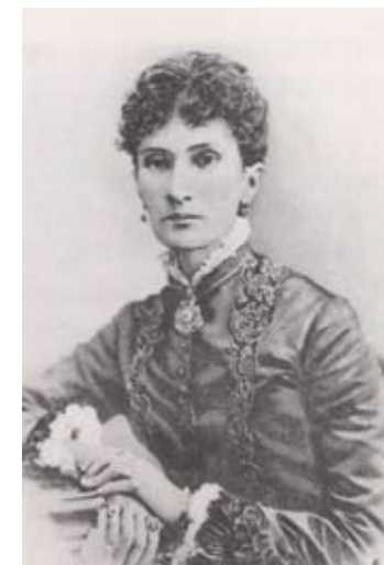
Nadesja Filaretovna von Meck