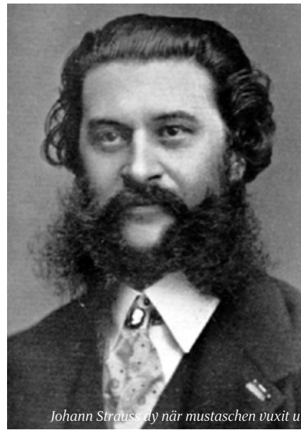
Johann Strauss d y när mustaschen vuxit ut

De båda bröderna stod varandra nära och ibland komponerade de musik tillsammans. Joseph var mycket road av hästsport och komponerade flera verk med anknytning till hästkapploppning. Den bästa av dem, den eleganta och medryckande Jockey-Polkan, skrev han strax före sin död. Den tredje brodern, Eduard, blev också en förnämlig valstonsättare, men långtifrån lika produktiv.