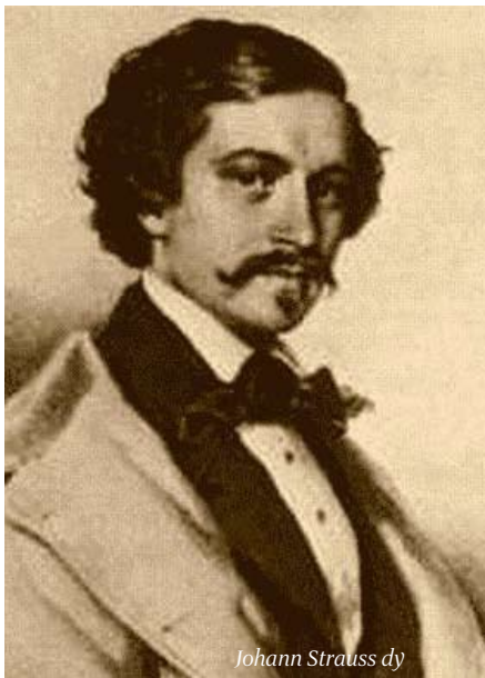
Johann Strauss d y

Yngre komponerade sin första vals redan som sexåring (så nog var han begåvad!) och innan han lade ner taktpinnen för gott 1899 hade han komponerat sådär 500 valser, galopper, polkor, marscher och hela operetter. Hans två år yngre bror Joseph hade försökt hålla sig till faderns kompositionsförbud, men när Johann d y 1853 drabbades av ett nervöst sammanbrott blev Joseph mer eller mindre tvingad att leda valsorkestern för att den inte skulle falla familjen ur händerna.