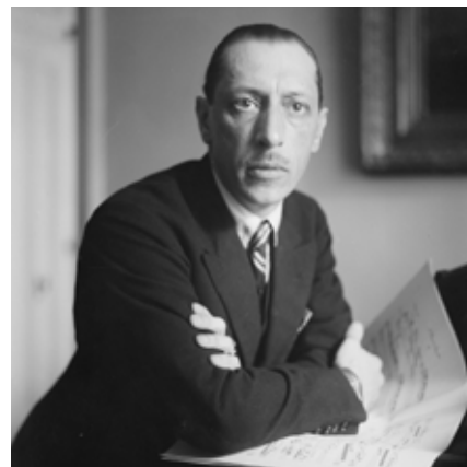
Stravinskij ca 1930

Eldfågeln var den första av de tre stora baletter Stravinskij komponerade för Djagilevs Ryska balett. Premiären 1910 blev en stor succé och Stravinskij förfärdigade direkt (1911) en svit. Denna använder samma jätteorkester som baletten och visade sig svårgenomförbar för normala symfoniorkestrar på grund av alla extramusiker. Av denna anledning omarbetade Stravinskij materialet till en ny svit, 1919, för en betydligt mindre besättning. För säkerhets skull gjorde han ytterligare en version 1945. Medan orkestreringen har något av en meskalindrogad Rimskij-Korsakov över sig, står harmoniken och balanserar mellan Den nya ryska skolan, Richard Strauss och Debussy, med glimtar av de grepp som senare skulle komma att dominera Stravinskijns musik.