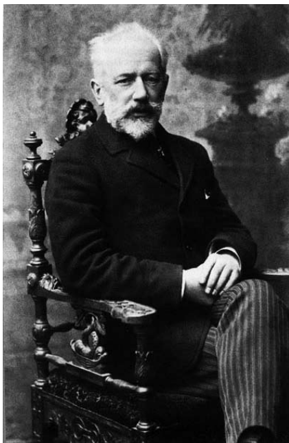
Tjajkovskij ca 1890 i Odessa