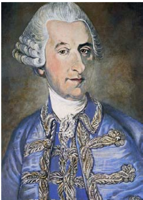
Joseph Haydn i Esterhazys livréuniform

Joseph Haydn komponerade ett flertal stora mässor och även en rad kortare stycken för kyrkligt bruk. I de allra flesta fall hade han fått en beställning på ett verk till ett alldeles speciellt tillfälle. Så var även fallet med detta storslagna, om än relativt korta, Te Deum som Haydn arbetade med år 1800. Skälet var att ingen mindre än den kände engelske generalen lord Nelson skulle komma på besök till Eisenstadt i september, alltså till furst Esterhazys slott där Haydn sedan decennier var verksam som hovkompositör och kapellmästare. Liksom i den något år tidigare komponerade Nelsonmässan använde sig Haydn av stora resurser, texter trumpeter mot två som var vanligast. Detta Te Deum är tillägnat kejsarinnan Maria Teresia, hustru till kejsar Franz II som började sin regeringsperiod 1792 och som med tiden skulle förlora alla slag mot Napoleon under de svåra krigsåren - utom