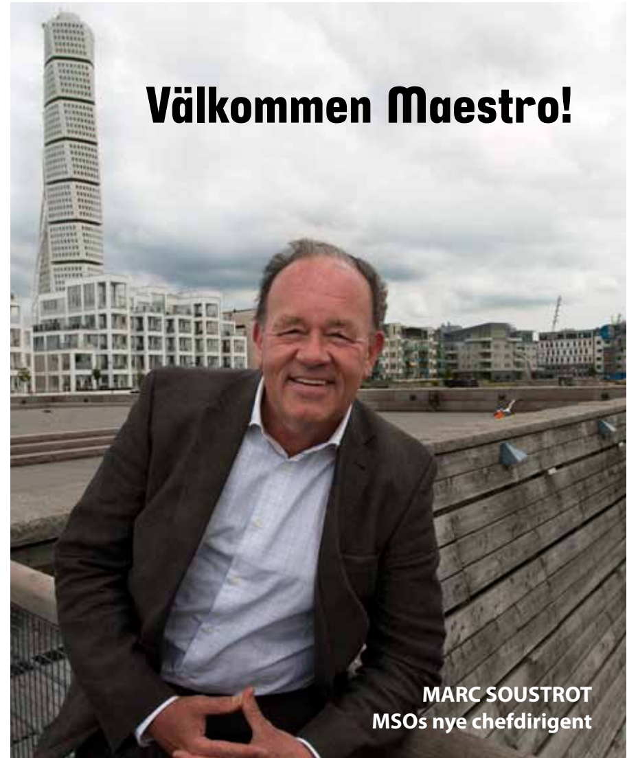
MARC SOUSTROT MSOs nye chefdirigent