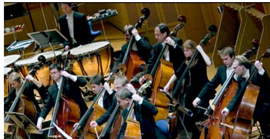
MSOs kontrabassection

Malmö SymfoniOrkester (MSO) består av 100 begåvade musiker som ständigt briljerar i ett rikt och mångskiftande konsertutbud. MSO är stolta traditionsbärare av den symfoniska repertoaren, men strävar också efter att föra den vidare in i framtiden. MSO lägger mycket energi på att hålla sig väl framme i de symfoniska trenderna i nuet och utveckla nya konsertkoncept, bl a dataspelsmusik och äventyr med olika teman. Nallekonserterna för de minsta är ett eget varumärke. Sommaren 2008 startade MSO ungdomsorkestern MSO Ung med talangfulla unga stråkmusiker från Skåne. Publiken i Malmö Konserthus är stor och entusiastisk, MSOs konserter har ca 90% beläggning. Flera inspelningar har blivit internationellt uppmärksammade med första pris i tävlingar som Cannes Classical