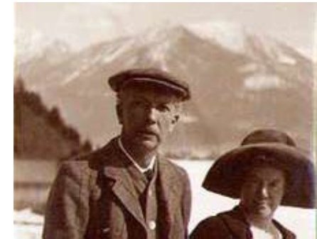
www.richardstraus.at "De skrev över 1500 brev till varandra, den korrespondensen avslöjar att utan farmor Pauline skulle inte ens en tredjedel av det han åstadkom blivit av."

själv, ett porträtt av hans egen hustru: "en aning pervers, lite kokett, aldrig sig lik från det ena ögonblicket till det andra...". Hustrun spelas av en halsbrytande bisarr soloviolin, som frejdigt dompterar hjälten i form av resten av orkestern. Strauss var också, enligt alla rapporter, helt under hustruns kommando. I avsnitt 4 utspelas striden i ett atonalt landskap, där hjälten utpräglat tonala motiv, trots upprepade försök, aldrig får slå igenom och bli det musikaliskt styrande. När den verkliga fienden dyker upp krossas hjälten som en lus av en ångvält. Först när striden är över i femte avsnittet sträcker han åter på sig till musiken från inledningstakterna. Resten av avsnittet fylls av en rad citat ur Strauss tidigare verk: Don Juan, Also sprach Zarathustra etc. För att sammanfatta: Hjälten är en småaktig typ som låter sig överköras av såväl hustru som fiender, men han skriver makalöst bra musik. I det avslutande sjätte avsnittet påbörjas en pastoral som emellertid hotas inifrån av en dovt pulserande puka. Och det blir värre, när sluttakterna börjar närma sig kastas musiken in i en skräckfylld mar-