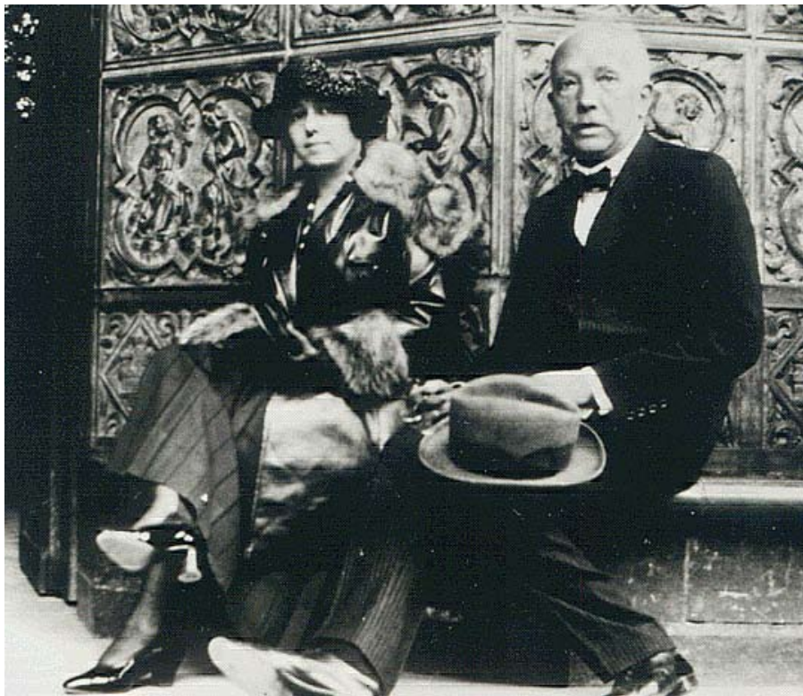
Richard Strauss guidade Elisabeth Schumann i Paris 1921 " Jag är en bra resebetjänt, en ordinär kompositör och en förskräcklig chef."

titlar emotsäger inte självförhärligandet, men om man ser till det musikaliska innehållet förändras bilden avsevärt. Avsnitt 1 är märkligt opersonligt och beskriver knappast Strauss, utan snarare Hjeltefasaden. I avsnitt 2 är det å andra sidan helt personligt Strauss kritiker det handlar om. De var inte många, men de irriterade honom tydligen så mycket mer. Hjälten är, med andra ord, småaktigt långsint. Det tredje avsnittet var, enligt Strauss