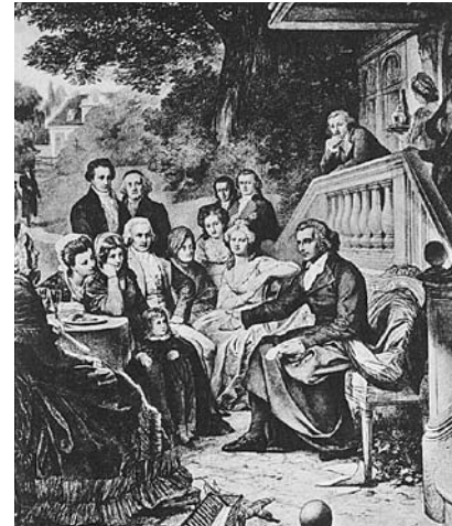
Schiller i Weimar.