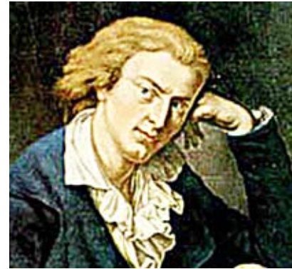
Friedrich Schiller, filosof, historiker, författare, dramatiker, poet, född 11 nov 1759 i Marbach am Neckar, från år 1787 bosatt i Weimar, död 9 maj 1805

Men åt oss är givet Att ingenstans finns ro, Så förtvinar, så falla, Lidande människor Blint från den ena Timman till den andra. Som vatten från klippa Till klippa kastat. Genom år av ovisshet.