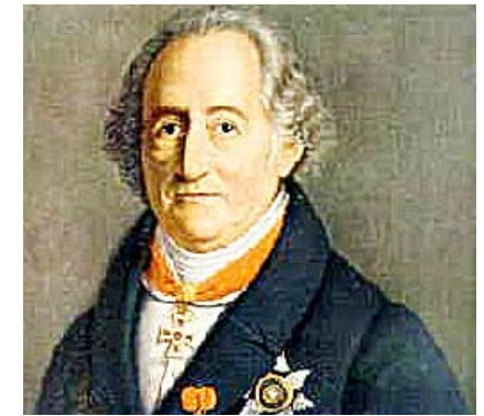
Johann Wolfgang von Goethe, född 28 augusti 1749 i Frankfurt am Main, Tyskland, död 22 mars 1832 i Weimar, tysk diktare, författare, poet och filosof