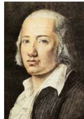
Johann Christian Friedrich Hölderlin, född 20 mars 1770 i Lauffen i Württemberg, död 7 juni 1843 i Tübingen, var en tysk författare och översättare