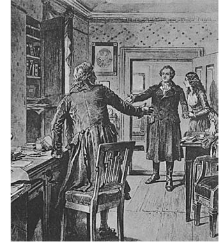
Schiller får besök av Goethe i Weimar.