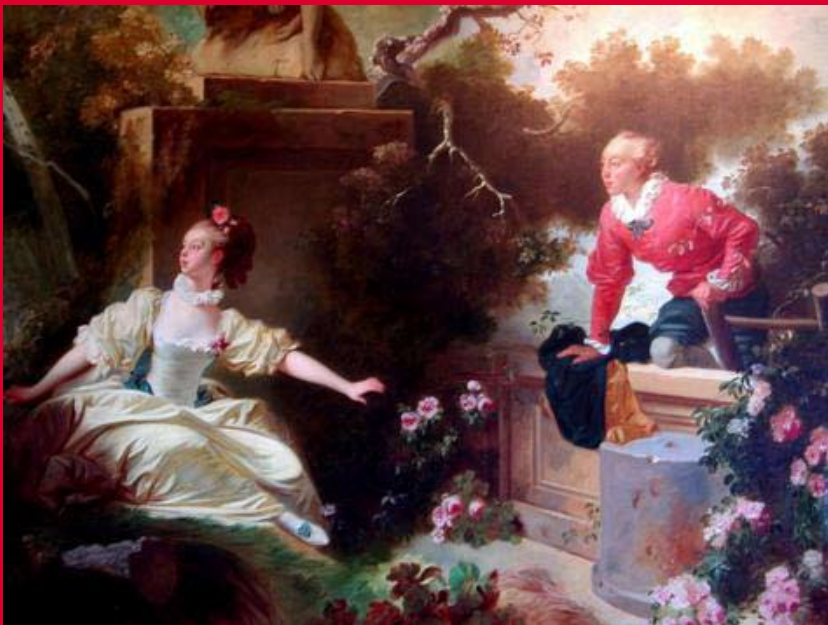
Kärlekens utveckling, monumental- målning i Fragonards hus och museum i Grasse, Provence, Frankrike