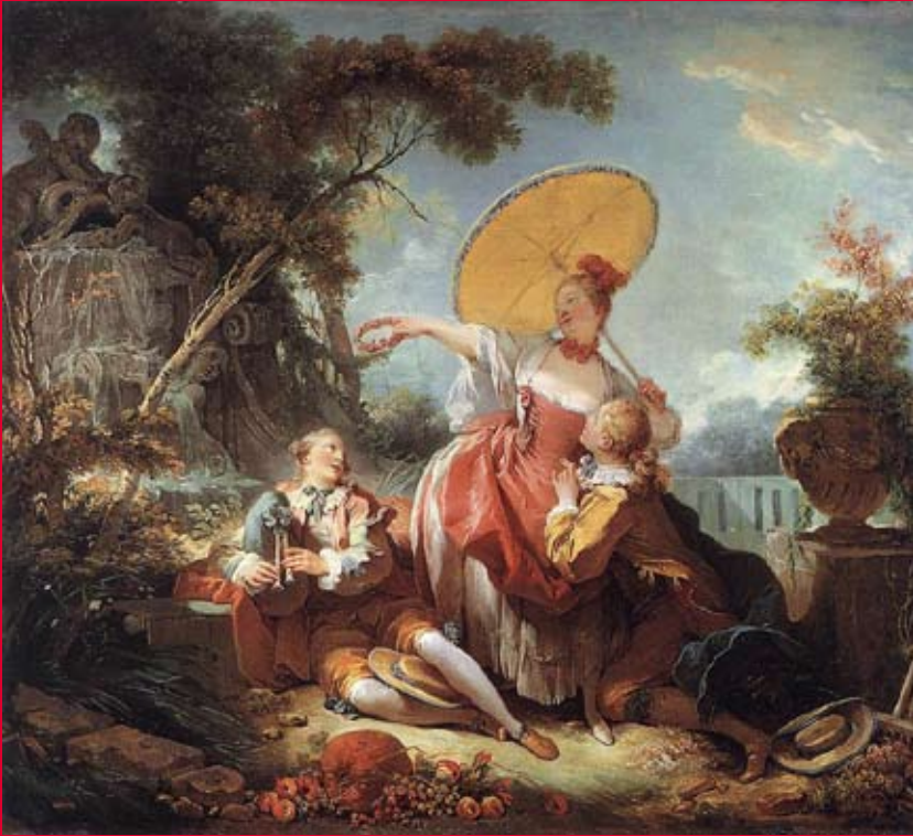
Musiktävlingen, olja på duk av Jean-Honoré Fragonard (1732-1806) Wallace collection, London