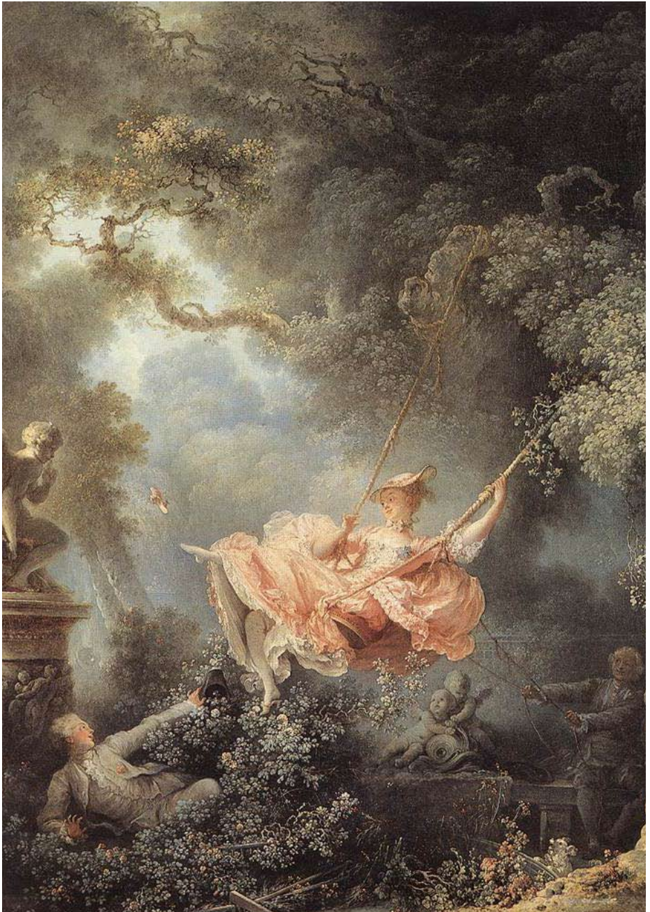
Gungan (beskuren), olja på duk av Jean-Honoré Fragonard, fransk rokokomålare Wallace Collection, London