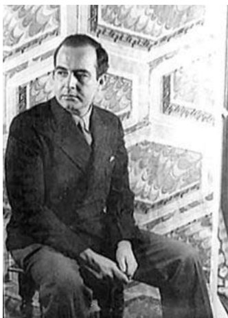
Samuel Barber 1944

Samuel Barber tillhör den betydelsefulla amerikanska tonsättargeneration som föddes i början av 1900-talet. Här finns namn som Aaron Copland, William Schuman, Walter Piston och Elliott Carter för att bara nämna några av de inflytelserika musikskapare som satt starka avtryck i det gångna århundradets musikliv. Gemensamt för dem, i alla fall under 1920- och 1930-talen, var ett sökande efter att förena erfarenheterna från den europeiska moderna musiken, som den representerades av t ex Ravel och Stravinskij, med en amerikansk ton. Mest konsekvent utforskades denna linje av Aaron Copland, som blev oerhört mönsterbildande, medan kanske Samuel Barber var den vars musik mest avvek från 1930-talets amerikanska norm. Han var inte speciellt intresserad av att fånga någon särskild amerikansk ton i sin musik, inte heller intresserade han sig, i alla fall vid denna tid, för tonala experiment eller urban