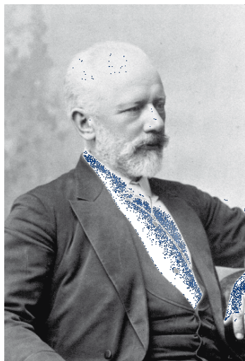
Pjotr Iljiti Tjajkovskij