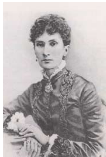
Nadesja Filaretovna von Meck

I mellansatserna har denna stämning en betydande plats i själva helhetsstrukturen." Blåsarnas inledande fanfarer är hotfulla och obevkliga. Tjajkovskij yttrade själv: "Inledningen innehåller fröet till hela symfonin, tveklöst kärnidén". Även om huvuddelen är valsartad och vek återvänder det obevkliga kärnmotivet. Mjukare slingor försöker göra sig gällande, men den tragiska stämningen förtätas och behåller sitt grepp. Andra satsen, som inleds med ett sångbart oboetema, andas melankoli och resignation, en längtan till ett förlorat paradistillstånd. Tredje satsens första del är ett stycke fantastiskt flimrande musik. Triodelens inledning har groteska inslag. I den följande delen ljuder marschmusik. Tre instrumentgrupper avlöser varandra: stråkar i första delen, träblåsare i andra och bleck i marschpartiet. I slutet blandas de tre grupperna. Finalsatsen är egentligen en variationssats över den ryska folkvisan Det stod en björk på ängen. Inte heller här glömmer Tjajkovskij, trots de mer positiva folkstämningensinslagen, sitt vemod och sitt lidande. Trots allt slutar symfonin i fest och glädje, bl a med fanfarerna från inledningen, ("fröet till symfonin").