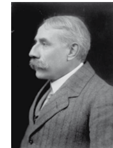
EDWARD ELGAR (1857-1934)

The Dream of Gerontius, oratorium för solister, kör och orkester, i två delar op 38 / 100 min inklusive paus