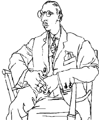
Stravinskij, teckning av Picasso

Stravinskij menade själv att han var "det kärlet ur vilket Våroffer flödade fram". Ursprunget till verket förstärker detta intryck av en redan existerande gestalt, som utnyttjade Stravinskij som medium. Detta är inte menat i spiritistisk bemärkelse utan snarare så att Våroffer låg berett strax under ytan av förkrigs-kulturen, stilutvecklingen och Stravinskij's medvetande. Givetvis krävde kompositionen ett jättelikt, medvetet konstruktionsarbete för att framföras, men ursprunget och drivkrafterna kan mycket väl ha legat färdiggestaltade. Den brutalitet vi har fått se utvecklas under 1900-talet tycks visserligen ha överraskat alla med första världskrigets utbrott, men måste ha existerat som en kännbar underström redan tidigare. Kring 1910 hade flera tonsättare brutit sig loss från traditionen och visat att ett nytt tonspråk var möjligt, så även musikaliskt kan Våroffer ha framstått färdiggestaltat för Stravinskij. Det finns också ett överväldigande barndomsminne som spelade en dominerande roll i verkets tillblivelse. Stravinskij svarade följande på Robert Crafts fråga om vad han älskat mest i Ryssland: "Den våldsamma ryska våren som tycktes komma igång under en timme och som gav intryck av att hela jorden sprack. Det var den mest underbara händelsen varje år av min barndom." Redan den ursprungliga idén till verket hade karaktären av något färdigt och utifrånkommande. Medan Stravinskij höll på med sluttakterna av