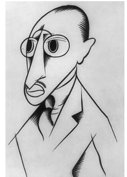
Stravinskij, teckning av Miquel Covarrubias

största intensitet, och hur ångest och hänryckning med den stigande saven griper växter och allt skapat. I förspelet (Lento) har jag anförtrött åt orkestern den fruktan, som varje känsligt väsen förnimmar inför elementens makt. Hela förspelet är hållet i mezzoforte. Melodin utvecklar sig i en horisontell linje, den stegas och avtager icke i och för sig, utan dynamiken uppkommer genom den växlande massan av instrument. Jag har velat återge naturens paniska skräck för den