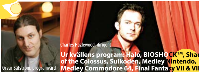
Charles Hazlewood, dirigent

Ur kvällens program: Halo, BIOSHOCK™, Shadow of the Colossus, Suikoden, Medley Nintendo, Medley Commodore 64, Final Fantasy VII & VIII