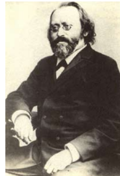
Bruch 1883 på sin Amerikaturné