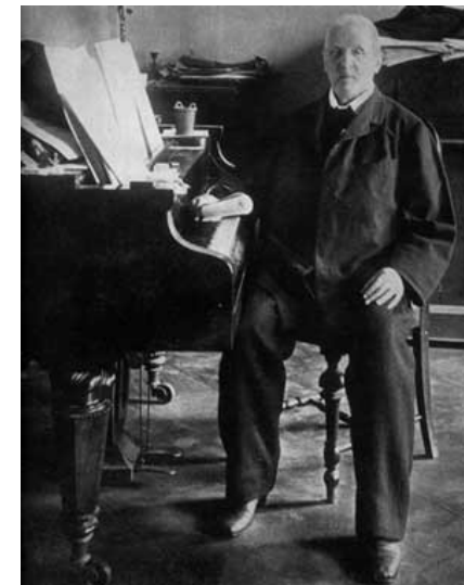
Anton Bruckner, född 4 september 1824 i Ansfelden, en förort till Linz, död 11 oktober 1896 i Wien, Österrike

Också i det efterföljande Adagiot är starka kontraster och spänningen mellan olika musikaliska material central. Redan i de allra första takterna ställs vida intervall och kromatik mot hymnisk treklangsharmonik. Liksom första satsen leds också denna sats mot ett dissonant klimax.