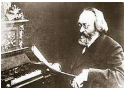
Max Bruch, född 6 januari 1838 i Köln, död 2 oktober 1920 i Friedenau, Berlin

när han själv skulle skriva sin violinkonsert, som också den fick en "ungersk" final. Ytterligare något som förenar dessa konserter är att de båda två tillägnades den store violinisten Joseph Joachim.