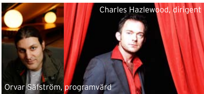
Charles Hazlewood, dirigent