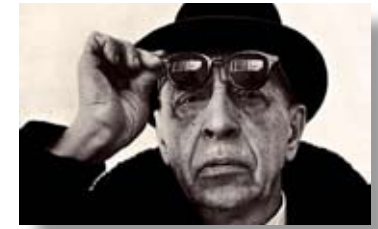
Igor Stravinskij (1882-1971)