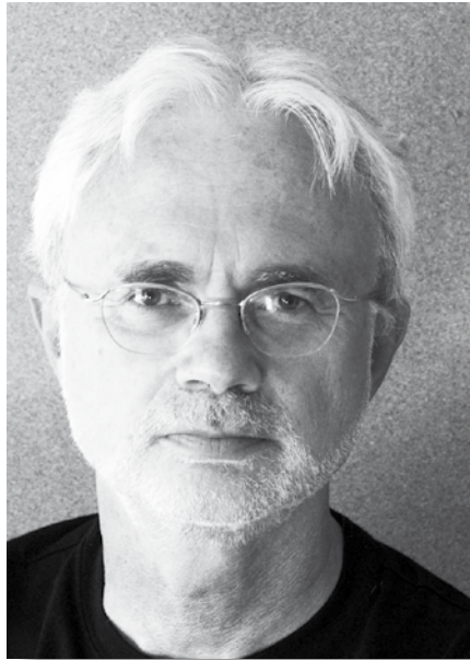
John Adams (1947)